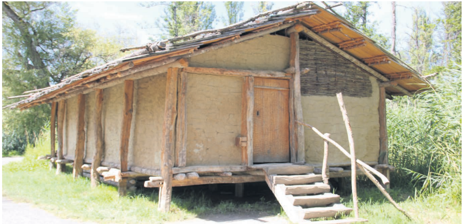
Originalgetreues Haus aus der Bronzezeit.

Auf der Halbinsel Riesi lebten zwischen 1050 und 850 vor Christus bronzezeitliche Bauern. Ihre Häuser errichteten sie auf unsicherem Grund nahe dem Wasser. Der sumpfige Boden war so weich, dass die Häuser schon nach wenigen Jahren versanken und unbewohnbar wurden. Über den Resten wurde neu gebaut, was für die Archäologie ein Glücksfall ist. Die Hölzer solcher Feuchtboden-Siedlungen bleiben erhalten, wenn sie dauerhaft unter dem Wasser liegen. Über 1,50 Meter dick war die