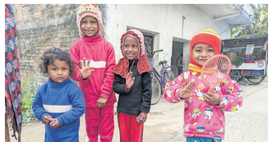
Die Menschen sind der Grund für den Einsatz in Nepal.