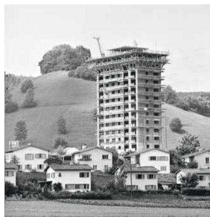
Das Hochhaus von Spreitenbach: 1959 konnte es fertig gebaut werden

gericht geführt wurde, durfte Della Valle weiterbauen. Das Hochhaus erhielt 13 Geschosse. In der Zwischenzeit hatten die Gemeindebehörden den jungen Planer Klaus Scheifele engagiert. Er erarbeitete einen Richtplan, der die Grundlage für den Bau der Hochhausstadt Neu-Spreitenbach wurde. Die Idee dahinter nahm viele der heutigen Raumplanungsdogmen vorweg. Zum Beispiel: Wer sich beim Bauen an die Vorschläge des Planers hält und Land für öffentliche Infrastrukturen abtritt, dem steht eine höhere Ausnützung und damit mehr Rendite zu.