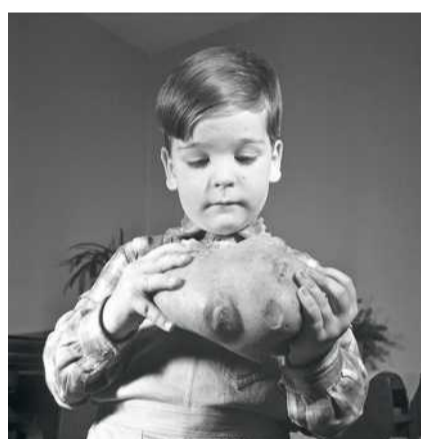
Was für ein Händöpfel! Geerntet 1952 in Frick