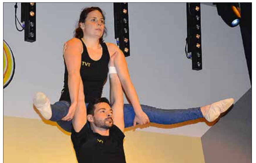
Überzeugende Darbietungen von Damenriege und Turnern.

Die Jugi-Mädchen widmeten sich in ihrer Aufführung den Haustieren Katze und Hund, während Damenriege und Turner das Thema Seitensprung wortwörtlich auf die Teufenthaler Bühne brachten. Auch nach der Pause zeigte sich das Publikum begeistert von Nummern wie «Wöschwiiber», dem WG-«Spieleabend» oder dem Fernsehabend der grösseren Jugiknaben. Gegen Ende des abwechslungsreichen Turnerabends durfte natürlich die grosse WG-Party nicht fehlen, an der doch die eine oder andere Überraschung mit im Programm war.