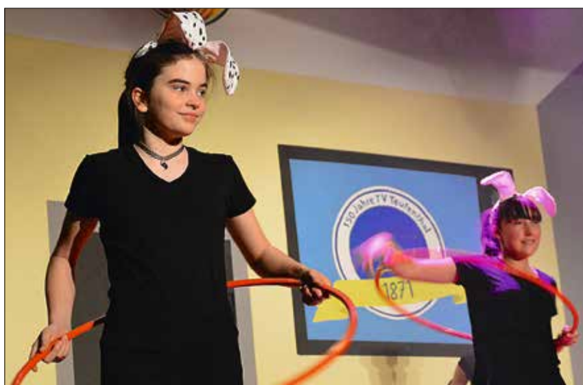
Die Jugi-Mädchen als bewegungsfreudige Haustiere.

Notfalldienst mittleres und oberes Wynental