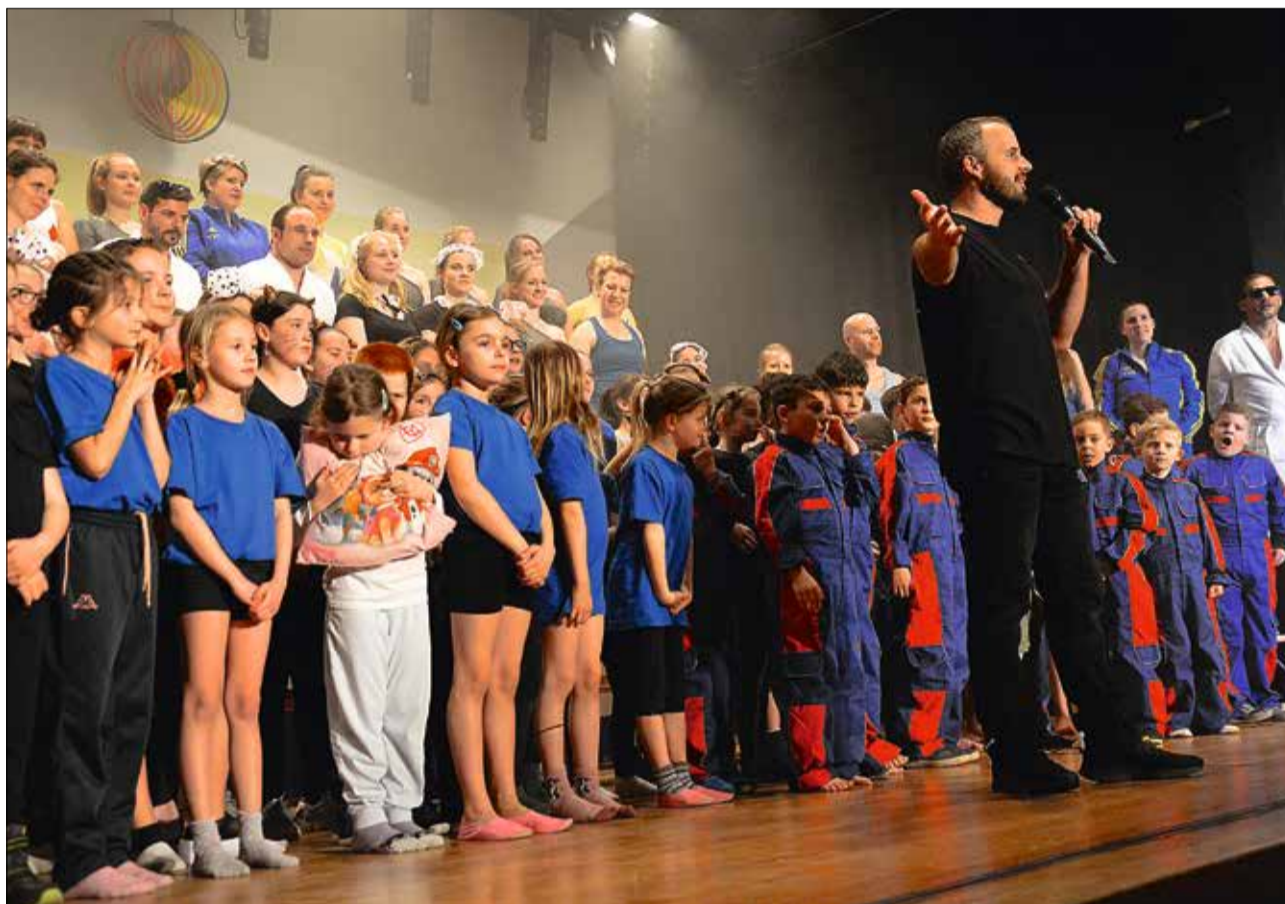
Imposantes Schlussbild mit allen Mitwirkenden des Turnvereins Teufenthal.

Gute Ideen, engagierter Einsatz von Technik und vor allem turnerische Leistungen auf Top-Niveau: das sind die Fixpunkte, aus denen in Teufenthal ein Turnerabend zusammengestellt wird. Am vergangenen Samstag suchte eine fiktive, leicht chaotische Turner-WG einen neuen Mitbewohner und die Besucherinnen und Besucher des Abends zeigten sich vom Programm begeistert. Am kommenden Samstag gibt es nochmals zwei Aufführungen in der Turnhalle Teufenthal.